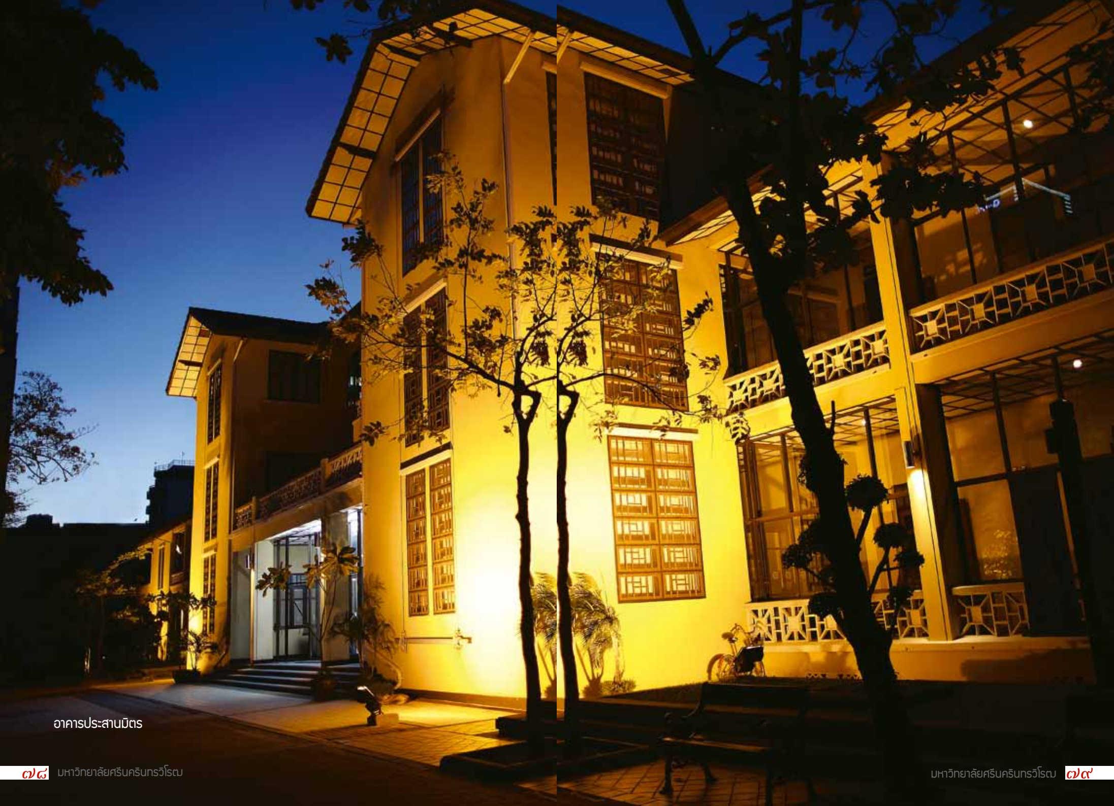
อาคารประสานมิตร