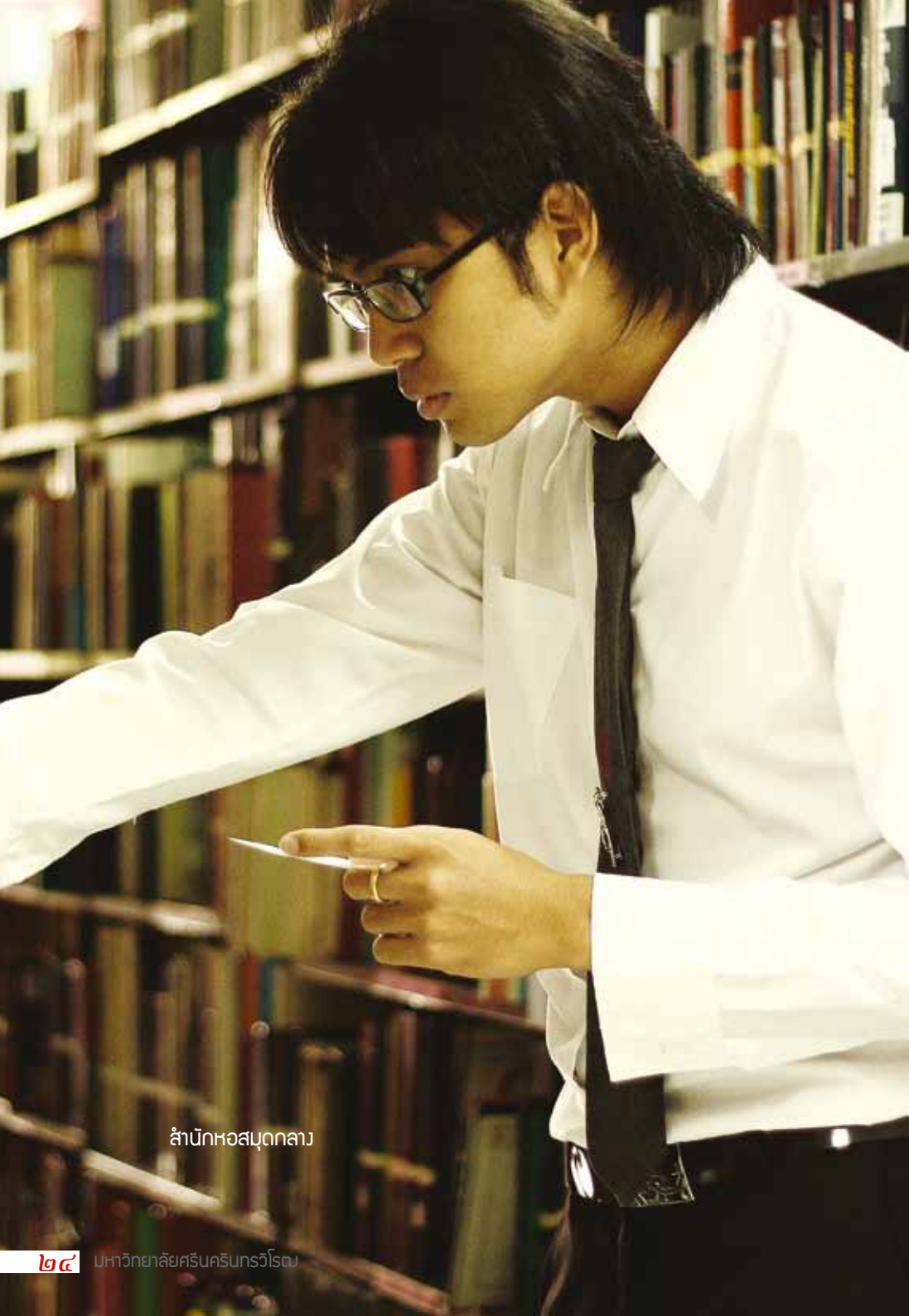
สำนักหอสมุดกลาง