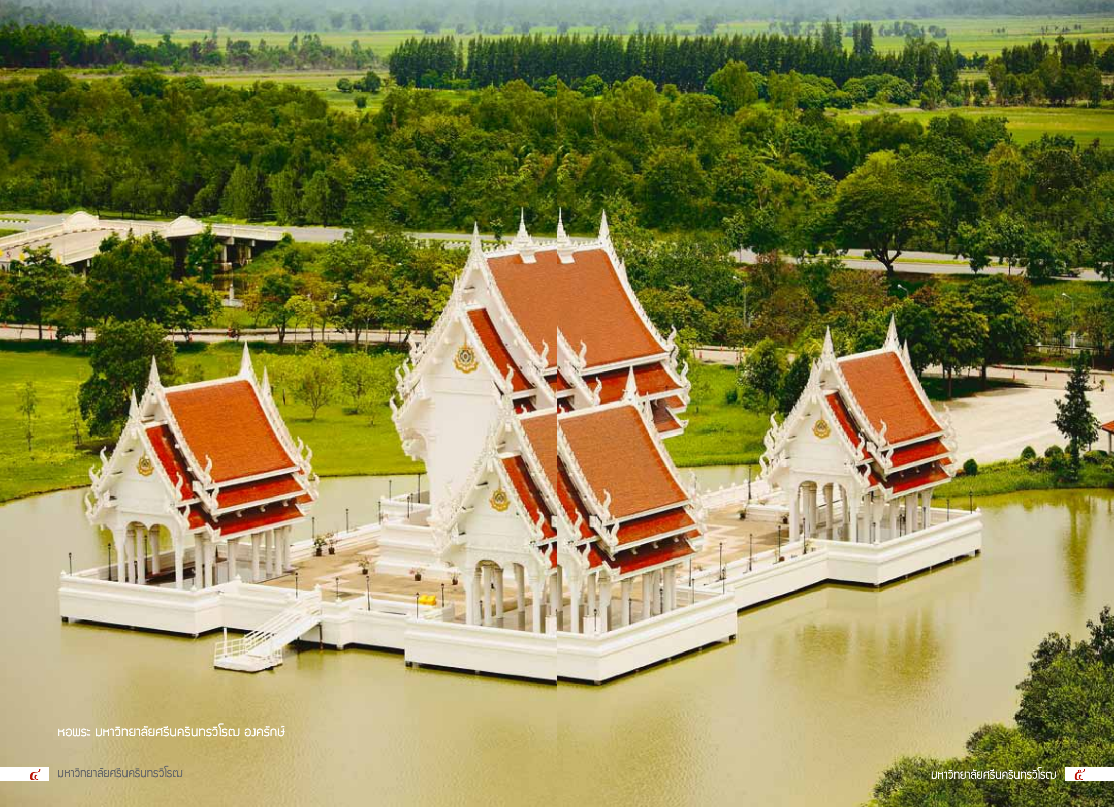
หอพระ: มหาวิทยาลัยศรีนครินทรวิโรฒ อวครักษ์